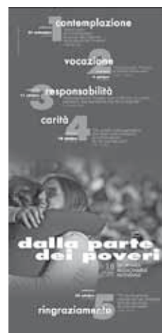
Locandina per il mese missionario: ottobre