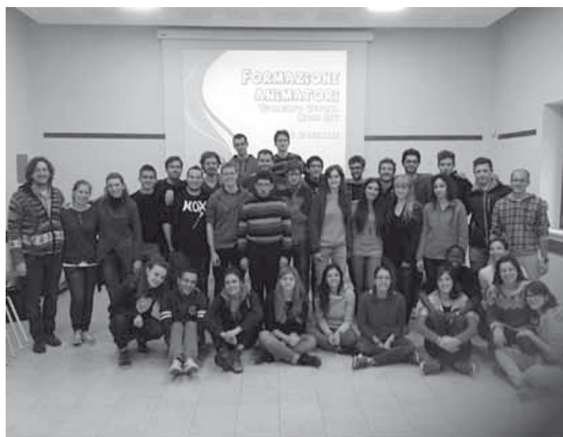
Formazione animatori, novembre