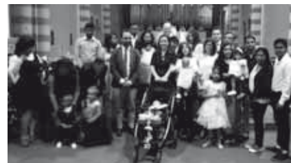
Battesimi di Domenica 13 settembre