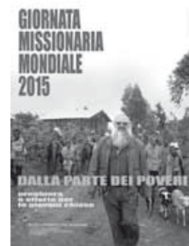
Manifesto dell'ottobre missionario 2015