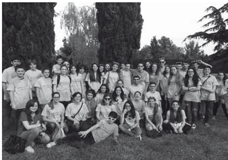
Festa del passaggio, terza media, maggio

In mezzo alla piazza ci sono due ragazze con una cartellina arancione in mano. Aspettano che arrivino le cinque per l'ora di catechesi. Ormai è diventata un'abitudine, sono in prima media, è da cinque anni che lo schema si ripete. Ad accoglierle ci sarà una stanza con dei cartelloni attaccati, tre catechiste e una ventina di ragazzi che come loro si aspettano un'ora di spiegazione sulla parabola del seminatore. Invece qualcosa è cambiato. Salgono le scale e sentono la musica di "Just Dance", entrano nella stanza e le sedie non sono più intorno al tavolo, ma contro le pareti. Insieme alle catechiste ci sono anche tre ragazzi poco più vecchi di loro. L'ora passa in fretta e alla fine nelle loro menti è rimasta una frase: "spargi semi al vento, vedrai fiorire il cielo".